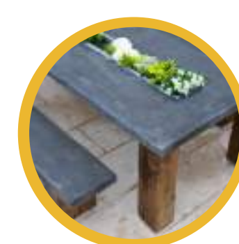
Diseño de interiores