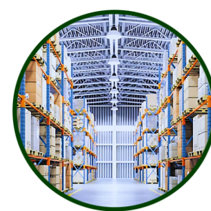
Bodegas de almacenamiento